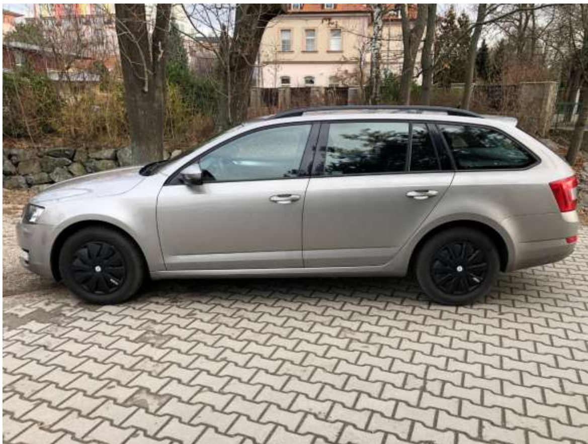
3. Pohled na vozidlo z levého boku.