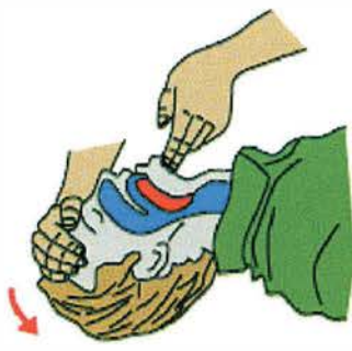
Uvolni dýchací cesty